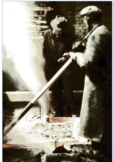
In der Glockengießerei in Apolda während eines Glockengusses